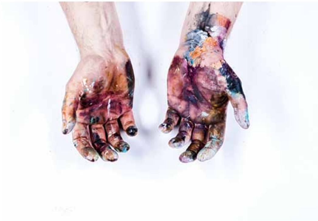
Susannah 2015, Ed 5 + 2AP, 30 x 40 cm, Fine Art Print