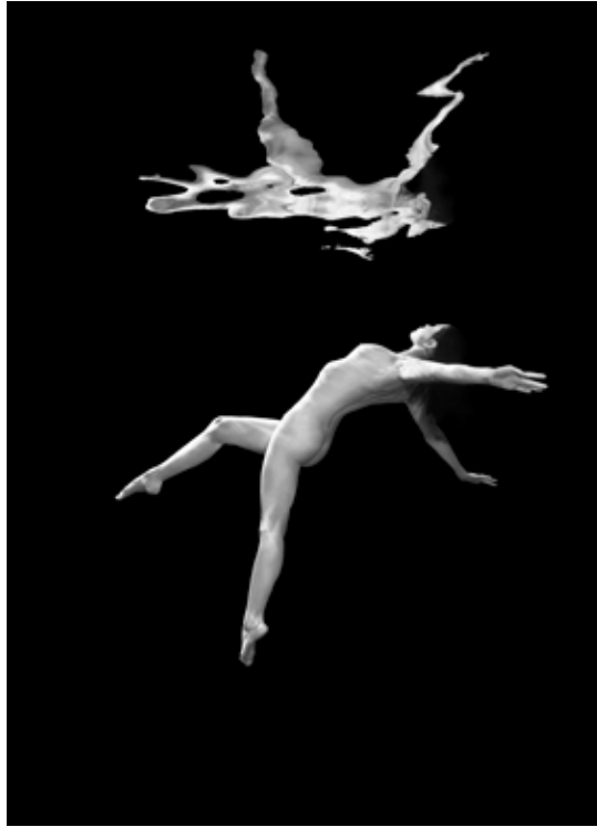
Underwater Nude II 2010, Ed 5 + 2AP, 30 x 40 cm, Fine Art Print